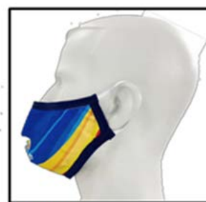
MODELO 003 Elástico para las orejas Acabado con ribete