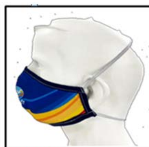
MODELO 002 Elástico completo Acabado con ribete